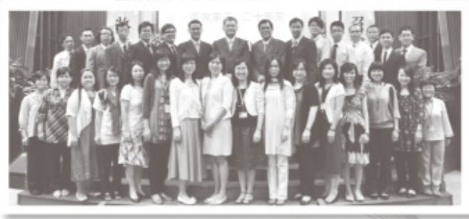
眾同工於崇拜前留影。