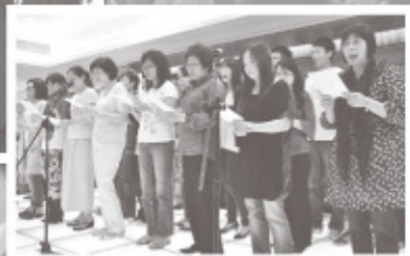
青牧義工團及愛心天使團獻唱。