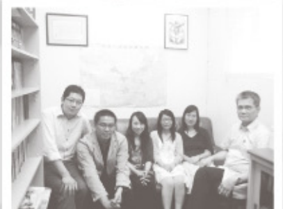
主管們在團牧辦公室。