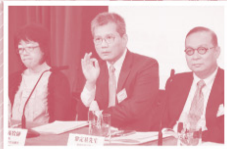
李Sir在懲教署主辦的NGO Forum。