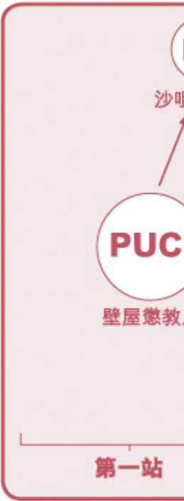
離所學員探訪同工並取回自製

牧養的需要，也不單在懲教院所內，也不只在被囚者的身上，因坐監不是一個人的事，而是整個家庭都牽涉在內，而且他們都承受著一種無