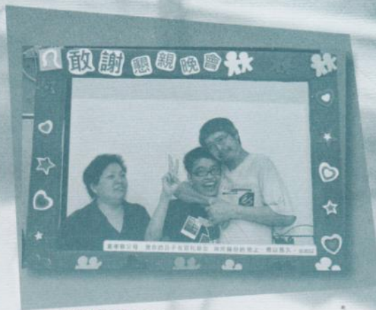
最溫馨及鬼馬家庭。