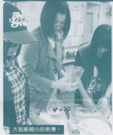
大姐組細心的教導。