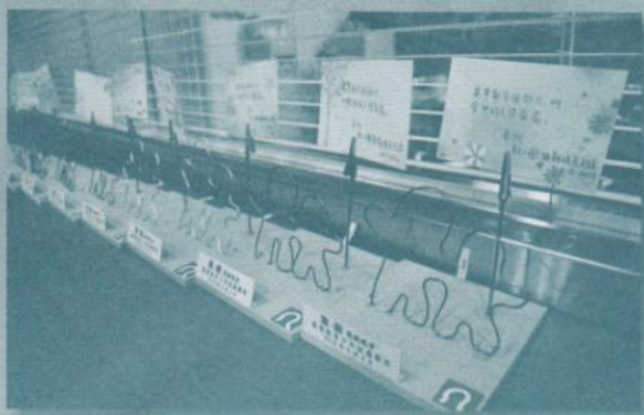
青少年親手製作禮物。