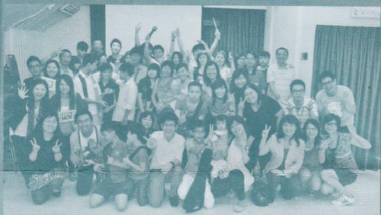
活動完結時，每個人臉上都是快樂和滿足。