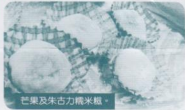
芒果及朱古力糯米糍。