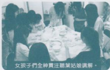
女孩子們全神貫注聽葉姑娘講解。