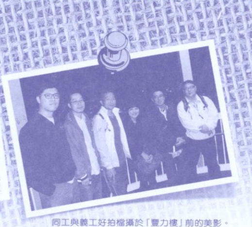
同工與義工好拍檔攝於「豐力樓」前的美影。