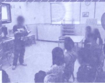
為你吹奏一曲，譜出神恩偉大！