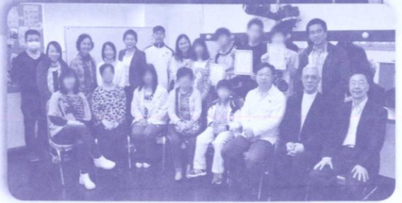
奉獻禮當天嘉賓、董事、同工、學員濟濟一堂。