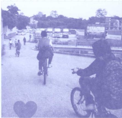
單車齊踏上，朝人生更美方向邁進。