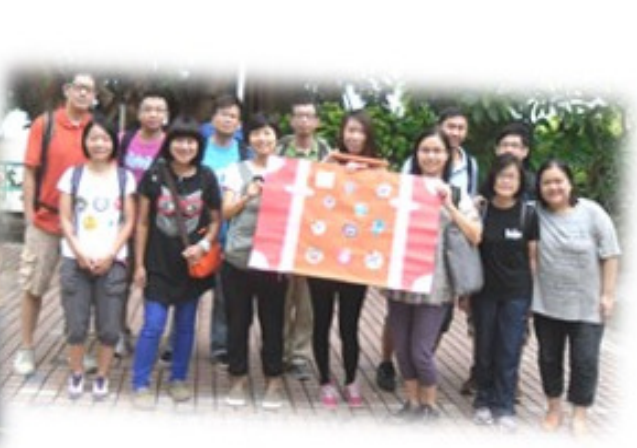
寶貴的三天，同工享受退修與相交。