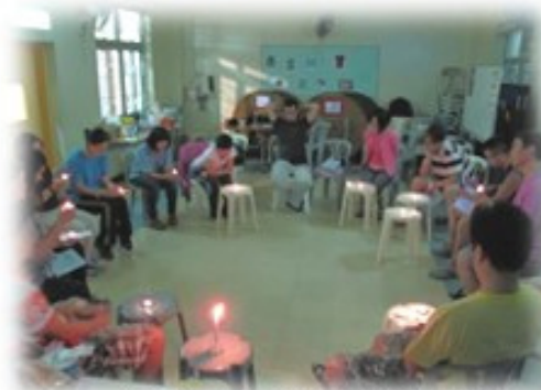
晚會中同工分享得著。