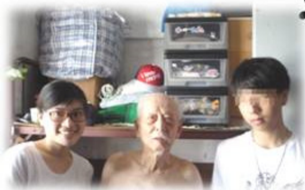
與長者傾談，關心問候。