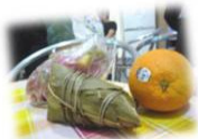
帶齊應節食品準備出發。