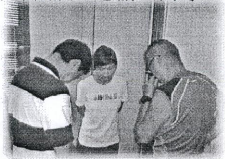
負責同工為聚會禱告。