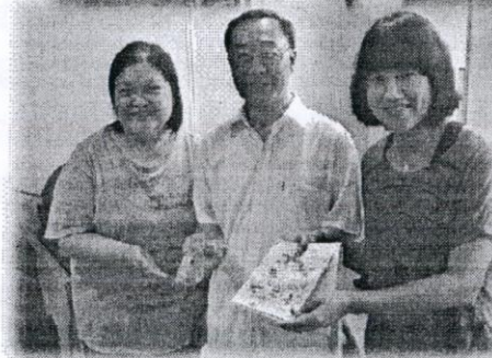
答謝總幹事的帶領。