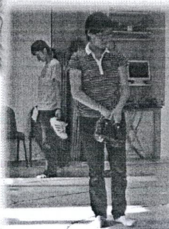
「明陣」有助同工深思經文。