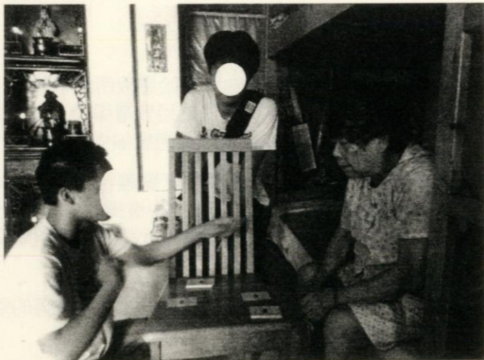
去年九月，同學（中）參加義工服務探訪長者

在青牧的工場，這樣的小羊很多啊！歡迎你和你的教會/團契也來一起牧養他/她們，一同見證小羊的改變，分享羊兒回家的喜樂！