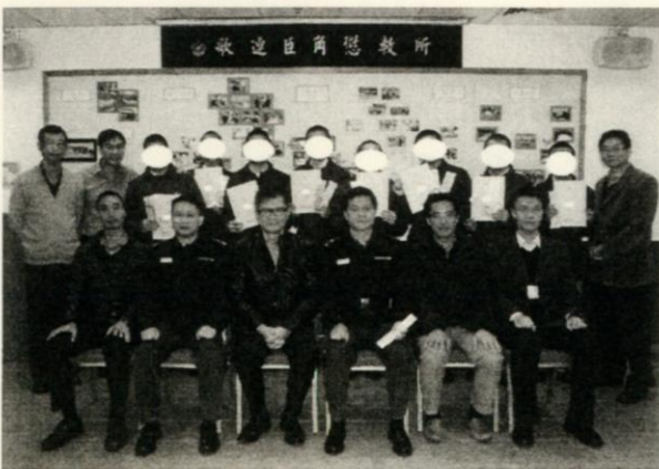
懲教職員、小繩大事小組及青牧同工在結業禮上留影

感謝主！透過這些活動，讓我們開啟被囚學員的心靈，與他們一起探索真我，重拾失落的愛，與人、與天父可重新結連。請禱告記念我們的工作，以及這些少年人和他們的家庭。