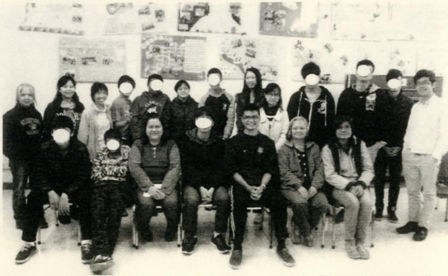
今年一月，同學和義工弟兄（前排中兩位）一起參加「除舊迎新義工服務」